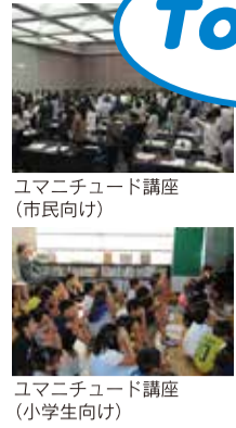
ユマニチュード講座 (市民向け) ユマニチュード講座 (小学生向け)

昨年2月に福岡市は医療・介護・地域団体など認知症施策に関わる関係者と共に「認知症フレンドリーシティ宣言」を実施しました。それから約1年半が経過した現在、具体的な施策が進化しながら多角的に展開されています。