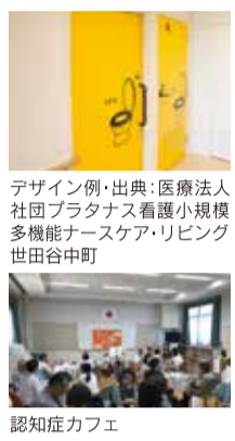
デザイン例

その一つが「ユマニチュード®の普及啓発」です。これはフランス発祥の認知症コミュニケーション・ケア技法で、多くの市民が認知症のことを理解し、正しい接し方ができるように普及が進められています。専門職向けや家族介護者向け講座はもちろん、地域向けや小・中学生向けなど幅広く講座を実施中で、昨年度は27回実施した講座を今年度は50回程度へと増やす予定です。